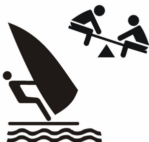
S34. Centar za slobodno vrijeme