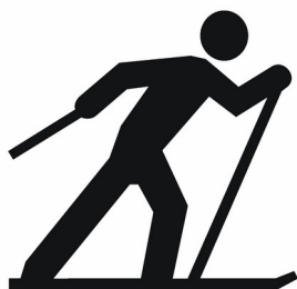
P38. Skijaško trčanje