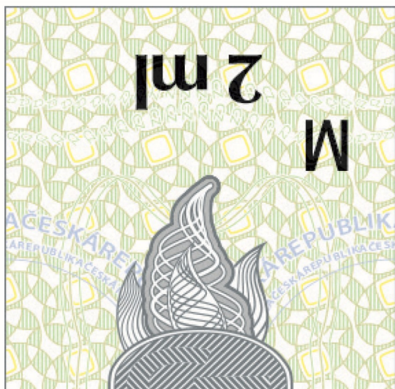
Kuva 6: Tupakkatarra sähkösavukkeiden patruunoiden vähittäismyyntipakkauksia varten