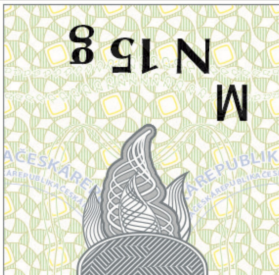
Kuva 8: Tupakkatarra muiden nikotiinituotteiden vähittäismyyntipakkauksia varten”.