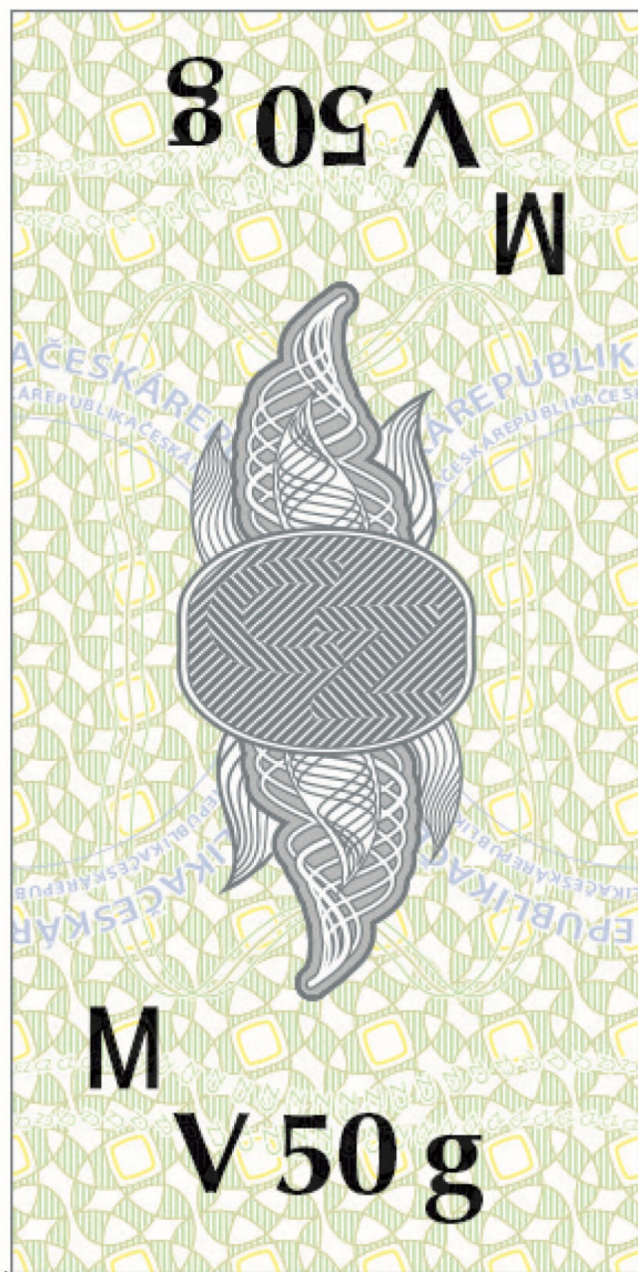
Vyobrazení č. 4: Tabáková nálepka pro jednotkové balení tabáku do vodní dýmky“.