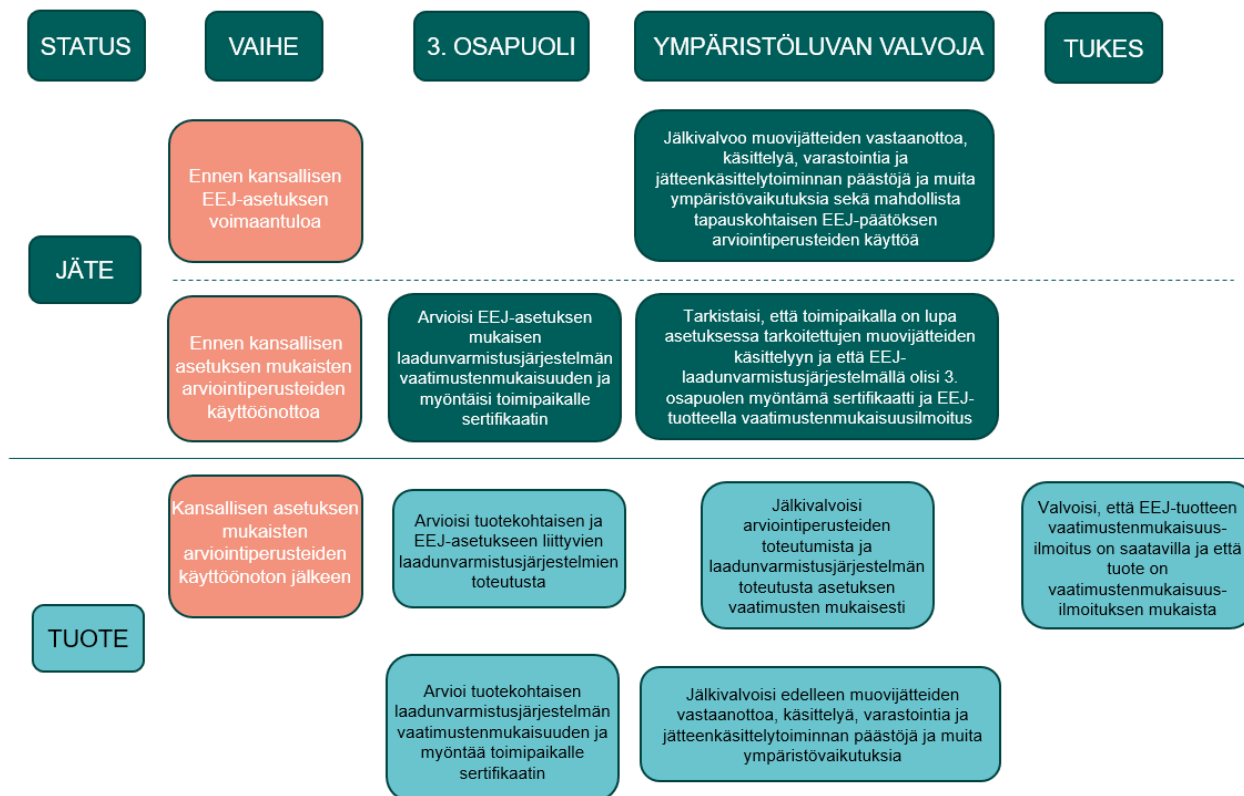
Kuva 2. Ympäristönsuojeluviranomaisen, Turvallisuus- ja kemikaaliviraston (TUKES) ja laadunvarmistusjärjestelmän vaatimustenmukaisuuden arvioivan kolmannen osapuolen tehtäväjako kansallisen EEJ-menettelyn soveltamisen eri vaiheissa ja tuote-jäte -rajapinnalla.

Ympäristönsuojeluviranomaisella olisi myös asetukseen liittyviä jälkivalvonnallisia tehtäviä (Kuva 1). Ympäristönsuojeluviranomainen tarkistaisi, että