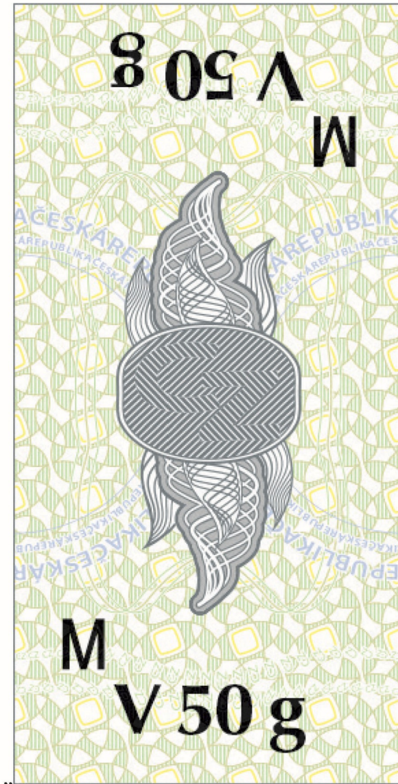
Abbildung 4: Tabáková nálepka pro jednotkové balení tabáku do vodní dýmky“.

1. In Anhang 1 wird nach Abbildung 3 folgende Abbildung 4 einschließlich ihrer Beschriftung eingefügt: