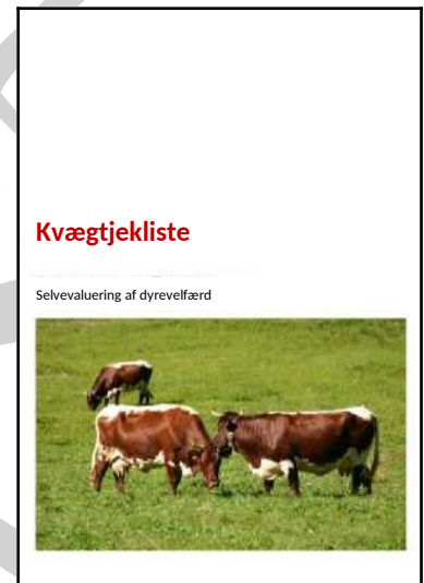
Tjekliste for selvevaluering af kvæg

Fra og med den 1. januar 2024 er det ikke længere tilladt i henhold til AMA-kvalitetsmærkeprogrammet for mælk at anvende tøjring med adgang til græsningsarealer/udendørs anlæg/anden mulighed for bevægelse i mindre end 90 dage om året. Tøjring på bedrifter med adgang til græsningsarealer/udendørs anlæg/anden mulighed for bevægelse i mere end 90 dage om året er stadig tilladt.