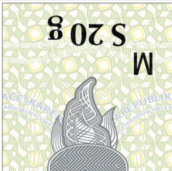
Joonis 7. Nikotiinitaskute tarbijapakendite tubakamärgis